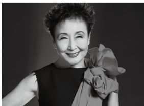
加藤登紀子 Tokiko Kato 카토토키こ