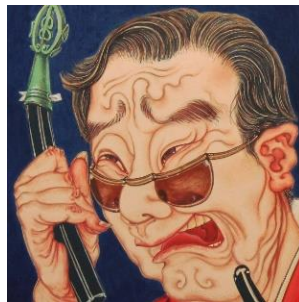
モノガタリ宇宙の会

スチャダラパーのANIとロボ宙、そしてAFRAで構成されるサウンドシステム。2022年初の7インチレコード「ディスコラップ」をリリース！