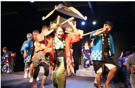
すみだで起こったさまざまな出来事を題材に脚本をつくり、50 歳以上の演劇部員が演じる「扉座大人サテライト」