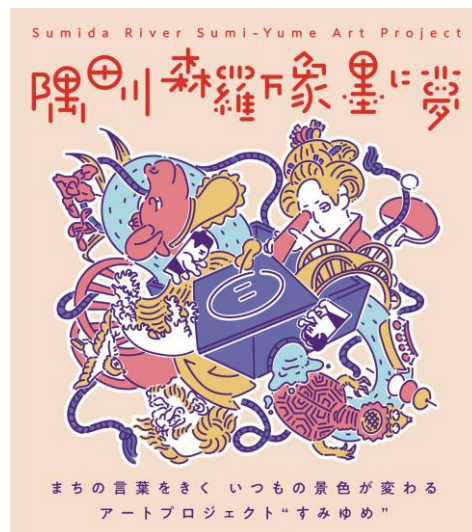
すみゆめ2024 キービジュアル

「隅田川 森羅万象 墨に夢」(通称：すみゆめ)は、すみだ北斎美術館の開設を機に2016年から始まったアートプロジェクトです。葛飾北斎が90年の生涯を過ごした墨田区及び隅田川流域で、墨で描いた小さな夢をさまざまな人たちの手で色付けしていくように、芸術文化に限らず森羅万象あらゆる表現を行っている人たちがつながり、この地を賑やかに彩っていくことを目指しています。開催期間中は、まちなかや隅田川を舞台に主催企画やプロジェクト企画を行うとともに、すみゆめ参加者や関心のある人たちが集う「寄合」(毎月開催)で相互に学び、交流する場を創出していきます。またメイン期間の外にも、すみゆめの趣旨に賛同する企画を「すみゆめネットワーク企画」として広報連携するなど、一年を通して活動しています。