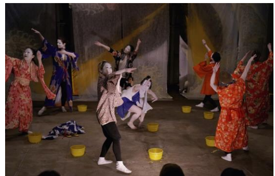
『北斎漫画』に描かれている人物像などをモチーフに、町工場、銭湯をテーマにしてきた北斎漫画舞踏、今回は、長屋をテーマに。