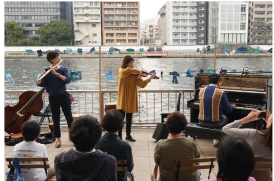
隅田川の親水テラスに置かれた一台のピアノをきっかけに音が人々をつなげる「ストリートピアノすみだ川」