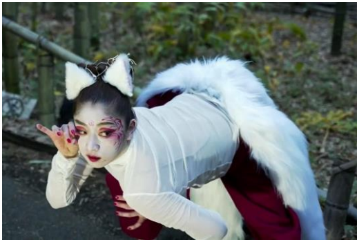
北斎の「百物語」に登場する妖怪たちを演じるパフォーマンスが公共空間に現れる「妖怪図鑑北斎百物語続々」