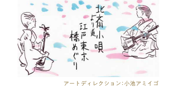
アートディレクション:小池アミイゴ

日時 10月19日(土)16:00開演(開場は30分前) 会場 YKK60ビル AZ1ホール(墨田区亀沢3-22-1) 料金 4,000円 申込 カンフェティ http://confetti-web.com/@hokusaikouta WEB https://www.youtube.com/@koutafiends6145 主催 明暮れ小唄 問合せ akekurekouta@icloud.com