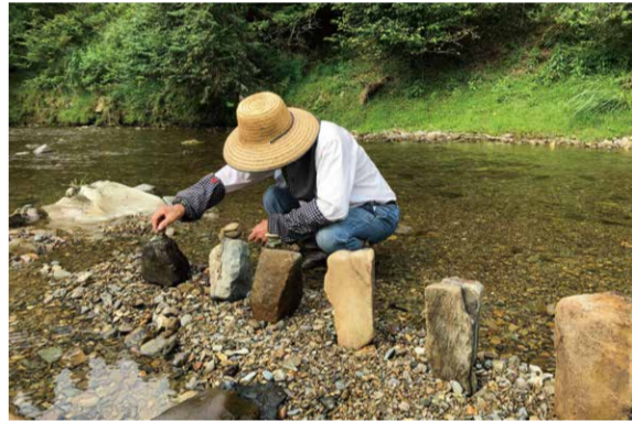
滋賀県の朽木古屋集落に伝わる民俗芸能「河原仏」

City Time in a Mystery Box 民俗芸能や祭りだけでなく、日々の暮らしの中にも存在する「祈り」。今を生きるわたしたちにとっての祈りとはなにか?というのがこのプロジェクトの出発点です。その問いの答えを参加者と一緒に探しています。多種多様な祈りが日常に受け継がれているすみだという土地で、約2m四方の箱を皆で移動させて、現代における祈りの意味や価値を考えるアート作品を創作します。