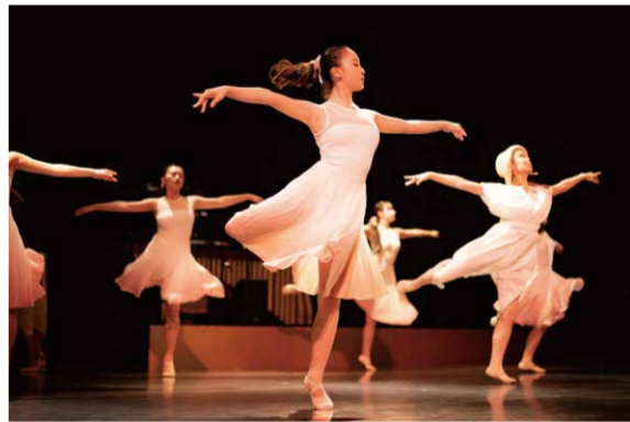
「翠色の光の物語」演出振付:吉崎裕哉

Sumida Mirai Artist Project Vol. 1 - "Hawk's Eye - The World Seen by Hokusai" 子どもたちを対象とした舞台創作プログラムの最終成果発表です。第一回となる今回は15名の「みらいアーティスト」が参加、プロのアーティストと共に北斎の「花鳥画」をテーマにした作品に挑み、森羅万象様々な現象、動物、草花を言葉を用いた身体表現で舞台上に表出させます。第一線で活躍するアーティストたちと、これからの未来を担う「みらいアーティスト」たちがどのような化学反応を起こすのか。北斎×子ども×舞台芸術のコラボレーションをお見逃しなく!また、12月21日には小学3年生から大人までを対象にしたワークショップも開催します。